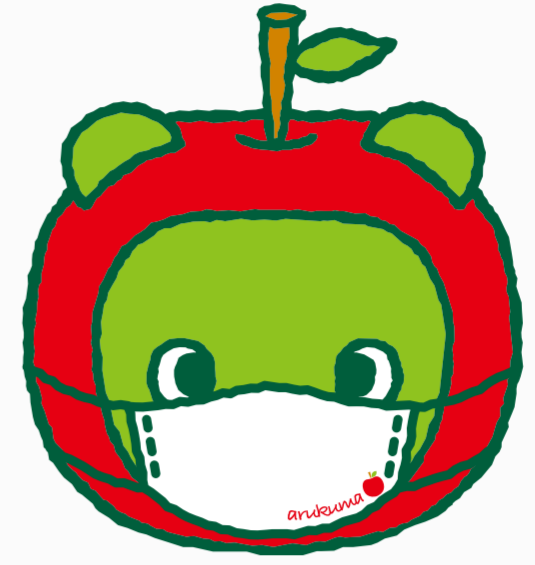
長野県PRキャラクター「アルクマ」 ©長野県アルクマ